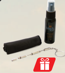
Sunglasses Care Kit