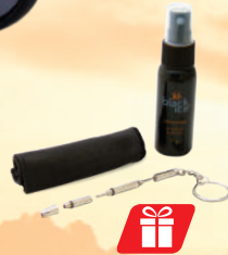
Sunglasses Care Kit