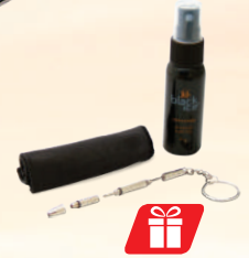
Sunglasses Care Kit